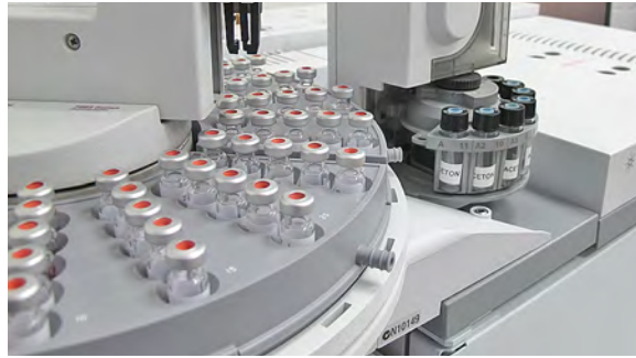
Labortest: Hier werden die Inhaltsstoffe untersucht

● Allergene Duftstoffe: 26 Duftstoffe mit erhöhtem Allergiepotenzial müssen ab 10 mg/kg auf dem Behälter der Produkte deklariert sein. Der K-Tipp zog über 10 mg/kg pro schwach allergenem Duftstoff 0,2 Noten ab, für stark allergene Duftstoffe eine ganze Note.